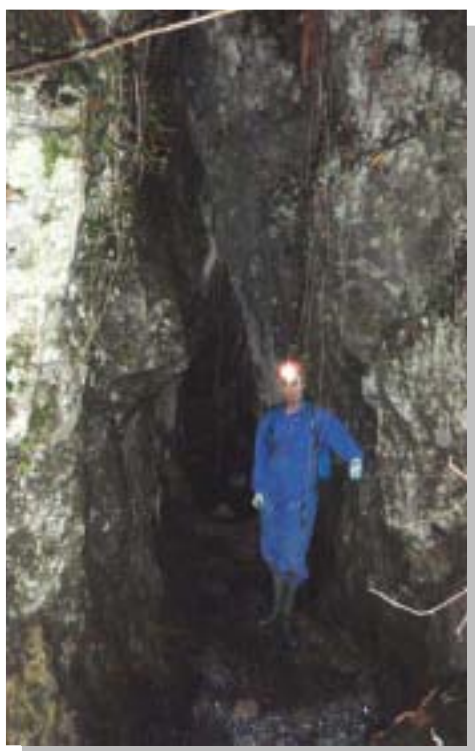
Boca de La Riega

Se ha realizado la topografía exterior hacia la cueva de La Riega para posicionarla sobre el plano geográfico al actuar ésta como surgencia siempre activa del sistema.