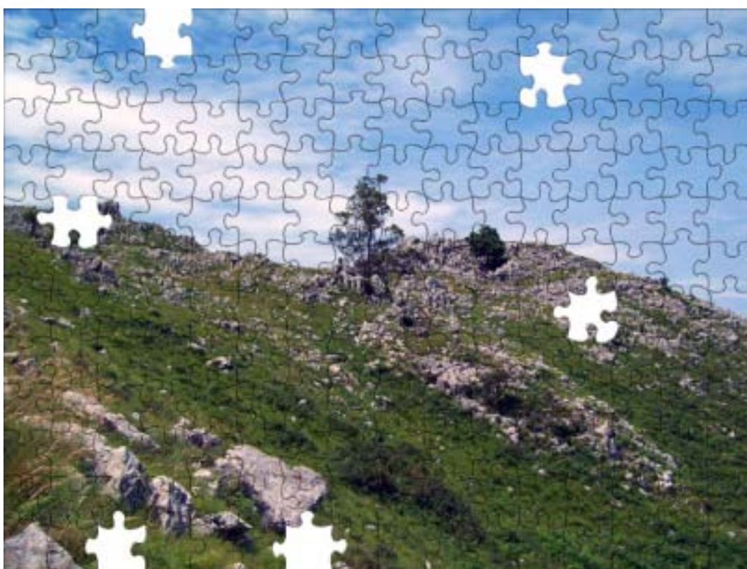
El puzzle de Riotuerto “donde” no encontramos las cuevas