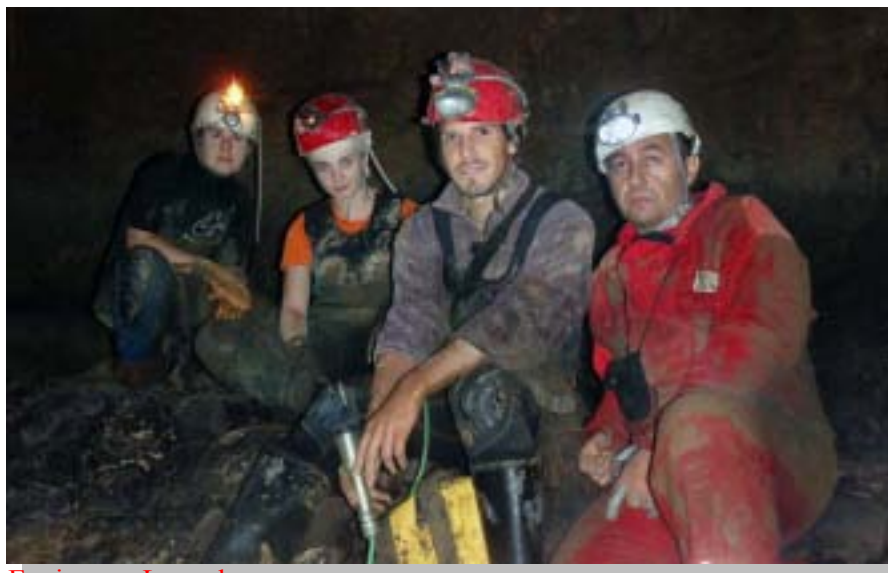
Equipo -en Laverde