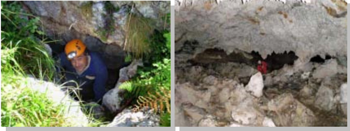
Boca e interior de Cuedavilloso